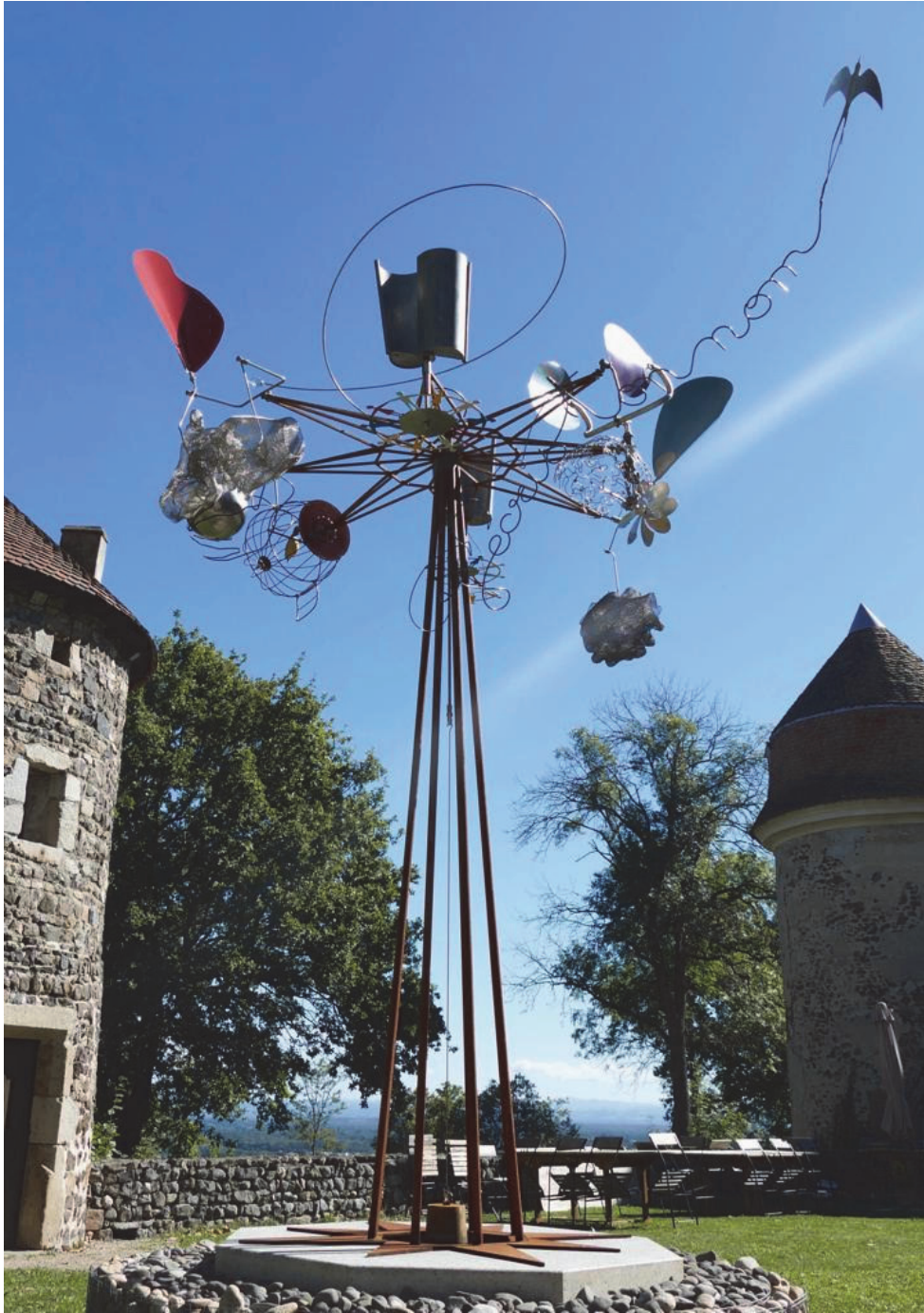
Antonio Benincà, Prototipo di La Boussole des Possibles , Castello di Goutelas